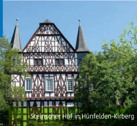
Steinscher Hof in Hünfelden-Kirberg

Gemeindeverwaltung Hünfelden, Le Thillay-Platz, 65597 Hünfelden, Tel. 0 64 38 / 83 80, gemeinde@huenfelden.de , www.huenfelden.de oder über die App der Gemeinde Hünfelden