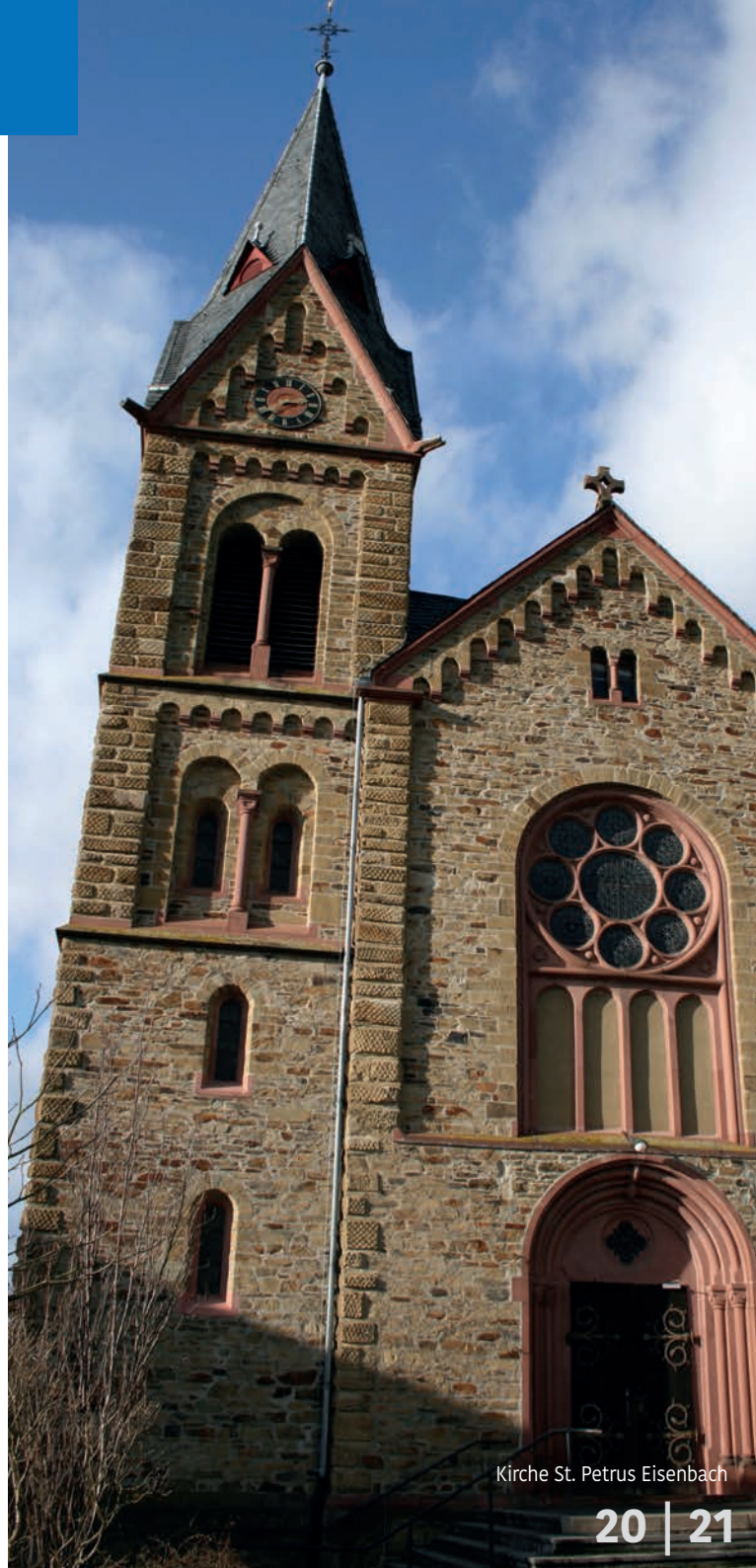
Kirche St. Petrus Eisenbach

Hofgut zu Hausen mit barockem Herrenhaus von 1662 und der Grabkapelle des Generalmajors August Freiherr von Kruse (1779-1848).