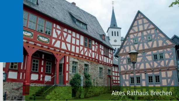
Altes Rathaus Brechen

Die schöne Gemeinde Brechen im ‚Goldenen Grund‘ bietet einige touristische Attraktionen. Neben dem fachkundig restaurierten historischen Ortskern von Niederbrechen und der sehenswerten Berger Kirche (910 n. Chr. erstmals urkundlich erwähnt) ist ein Besuch im Heimatmuseum in Oberbrechen lohnenswert. Die gezeigten Exponate vermitteln einen lebendigen Eindruck vom Alltagsleben früherer Generationen. Altes Handwerk, Schule und Beruf, Religion und Privatleben, aber auch Krieg und Vertreibung werden dargestellt. Im „Großen Wald“ östlich von Oberbrechen befindet sich die Alteburg. Die noch gut erhaltene Wallanlage fungierte als früh Römisches Lager und ist heute ein schützenswertes Bodendenkmal nach dem Hessischen Denkmalschutzgesetz. Rund 60 Hügelgräber aus der Hallstattzeit (etwa 500 v. Chr.) in unmittelbarer Nähe der Anlage zeugen von längst vergangenen Zeiten.