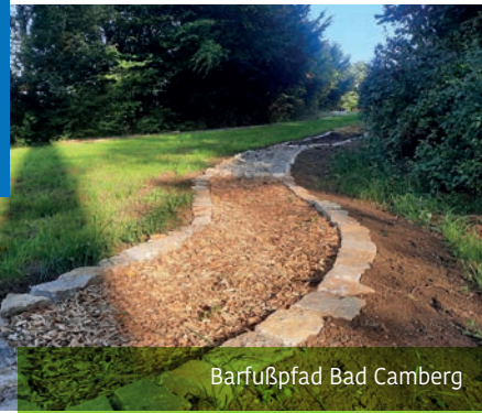
Barfußpfad Bad Camberg

Tourist-Info Bad Camberg , 65520 Bad Camberg, Tel. 0 64 34 / 20 24 12 oder 20 24 11 kurverwaltung@bad-camberg.de www.bad-camberg.de